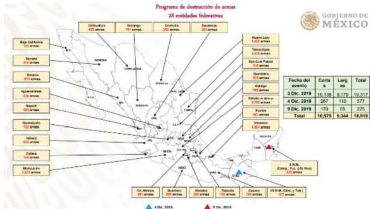
Mapa 1. Programa de destrucción de armas en 28 entidades.